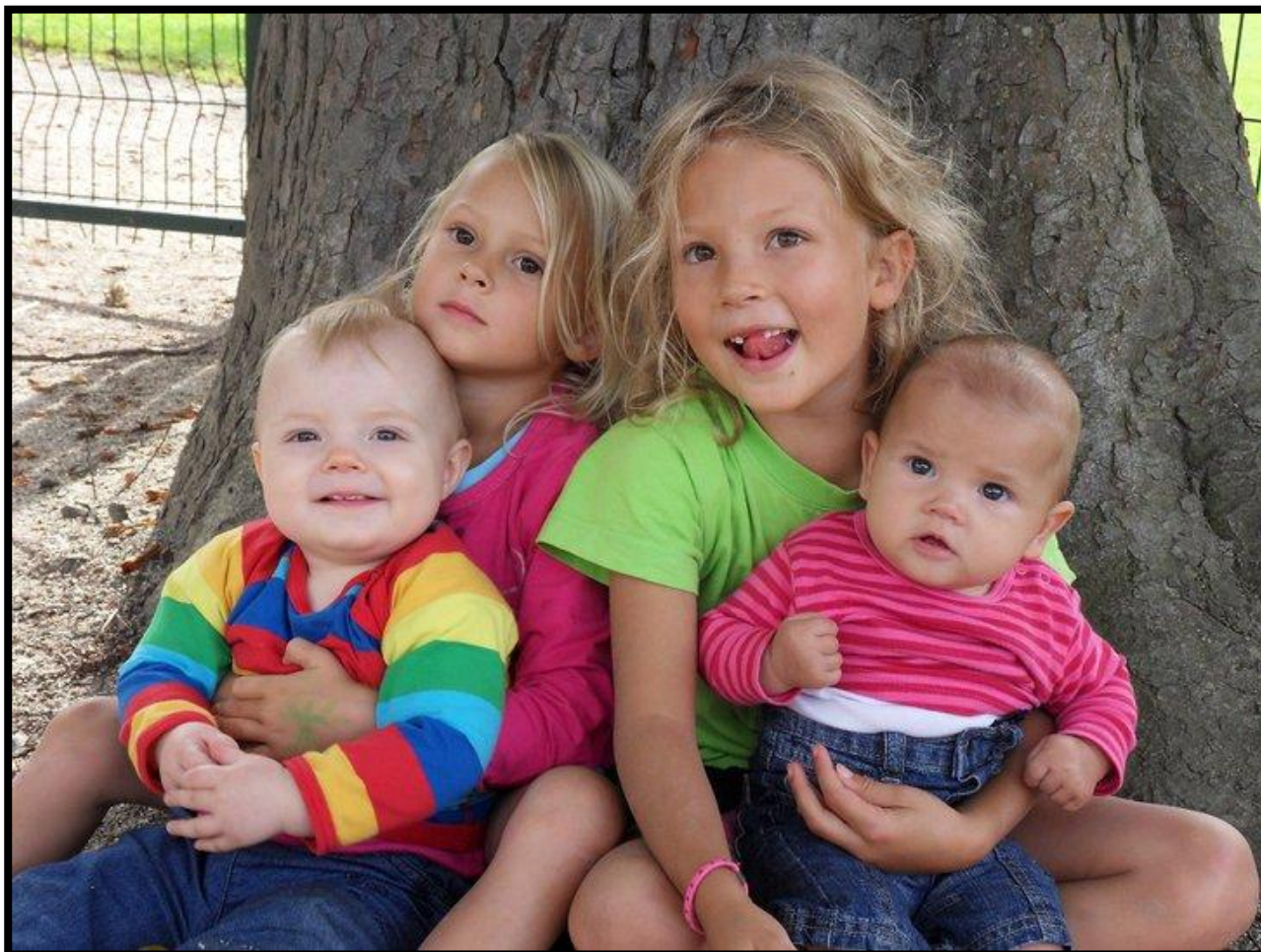
Figur 4: 4 børnebørn fotograferet for et års tid siden