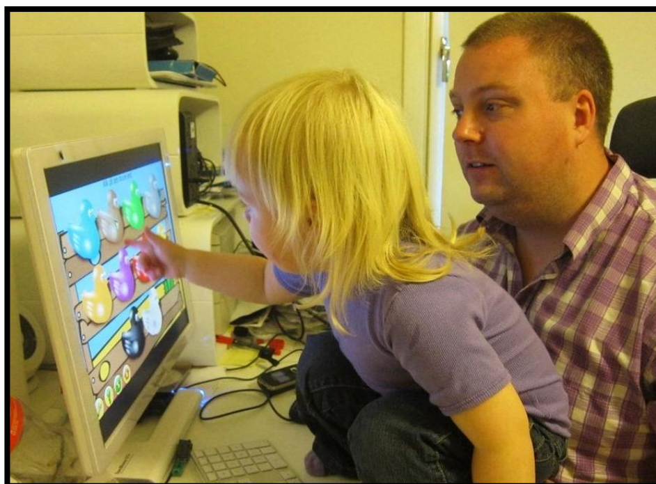
Figur 1 Godt at vi har dygtig computer-ekspertice i familien

hun syntes, at pigerne var blevet meget store.